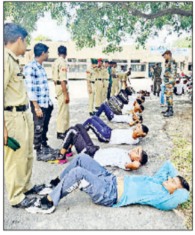
बहादुरगढ़। राजकीय महाविद्यालय में एनसीसी कैडेट्स का चयन करते अधिकारी।