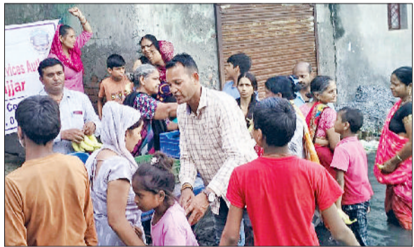
बहादुरगढ़। जलभराव क्षेत्रों में नागरिकों को राहत सामग्री वितरित करते पीएलवी।

हरियाणा राज्य विधिक सेवा प्राधिकरण के आदेश अनुसार जिला विधिक सेवा प्राधिकरण द्वारा बहादुरगढ़ में जलभराव से प्रभावित नागरिकों को राहत सामग्री वितरित की गई। जिला एवं सत्र न्यायाधीश