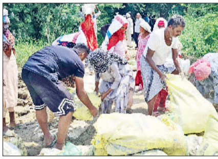
बहादुरगढ़। तटबंधों पर मिट्टी के कट्टे लगाते टीम के सदस्य।