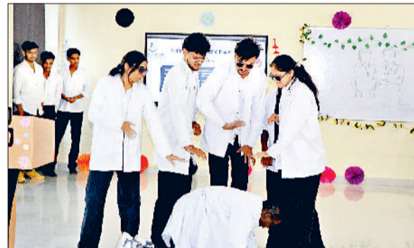
झज्जर। कार्यक्रम के दौरान प्रस्तुति देते हुए विद्यार्थी।

संस्कारम विश्वविद्यालय के स्कूल ऑफ हेल्थ एंड एलाइड साइंस के डिपार्टमेंट ऑफ फिजियोथैरेपी द्वारा मंगलवार को फिजियोथैरेपी-डे मनाया गया। कार्यक्रम के अंतर्गत विद्यार्थियों ने पोस्टर प्रेजेंटेशन, मॉडल मेकिंग, रिसर्च पेपर प्रेजेंटेशन, स्पॉट्स एक्टिविटी और क्विज प्रतियोगिताओं का आयोजन किया गया। कार्यक्रम के मुख्यातिथि