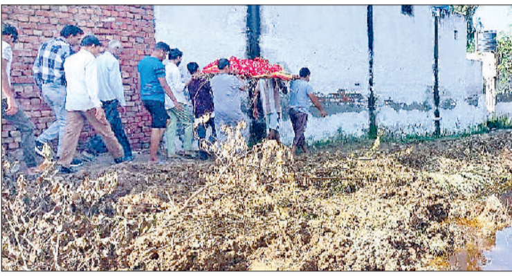
झंझर। शव ले जाते हुए कालोनीवासी व गली में हुआ जलभराव।