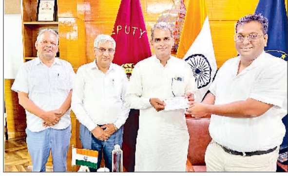
झज्जर। डीसी की सहायता राशि के चेक सौंपते छुछकवास ग्राम पंचायत