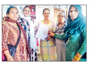
झज्जर। कार्यक्रम के उपरांत ज्ञापन सौंपते हुए कर्मचारी।