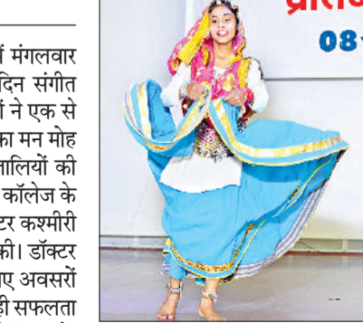
झज्जर। कार्यक्रम के दौरान अपनी प्रस्तुति देती प्रतिभागी।