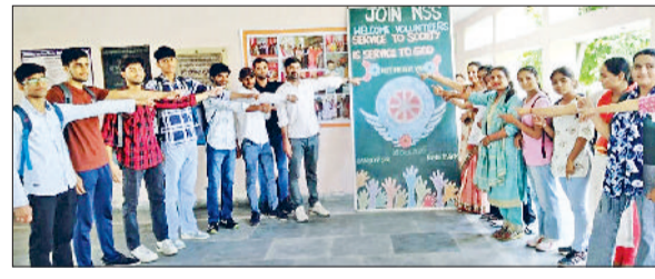
बहादुरगढ़। कार्यक्रम में मौजूद एनएसएस छात्र।