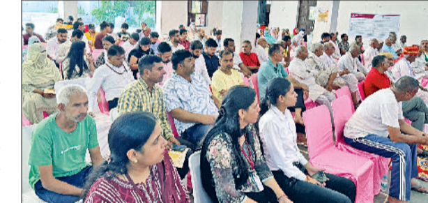
बहादुरगढ़। सराय औरंगाबाद में लगे कैम्प में मौजूद ग्रामीण।