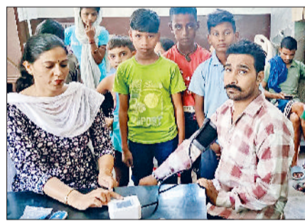
बहादुरगढ़। शिविर मरीजों की जांच करते चिकित्सक।