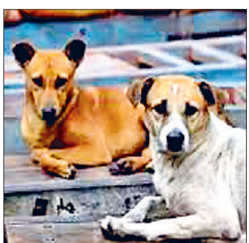
कोर्ट व पशु कल्याण बोर्ड की हदियारों का पालन होगा। टेंडर की शर्तों के मुताबिक एजेंसी को वेटनरी डॉक्टर, दवाइयां, कुत्तों को

टेंडर की शर्तों के मुताबिक एजेंसी को वेटनरी डॉक्टर, दवाइयां, कुत्तों को पकड़ने व रखने का इंतजाम खुद करना होगा। नसबंदी और टीकाकरण के बाद कुत्तों को उसी स्थान पर छोड़ा जाएगा, जहां से उन्हें पकड़ा गया था।