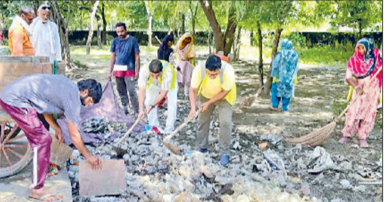
बहादुरगढ़। कम्युनिटी सेंटर में की जा रही सफाई।